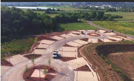
Neubau Wohnmobilstellplatz, Saarland Thermen Resort Rilchingen