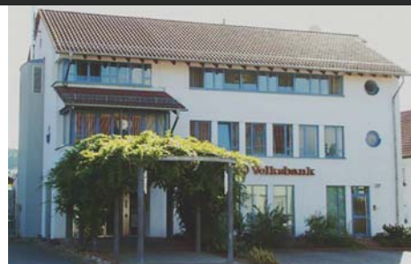
An-/Umbau, Aufstockung Bankgebäude, Mandelbachtal-Ormesheim