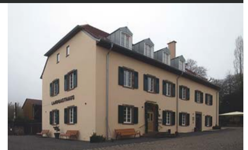
Rekonstruktion Mittelgebäude, Wintringer Hof Kleinblittersdorf