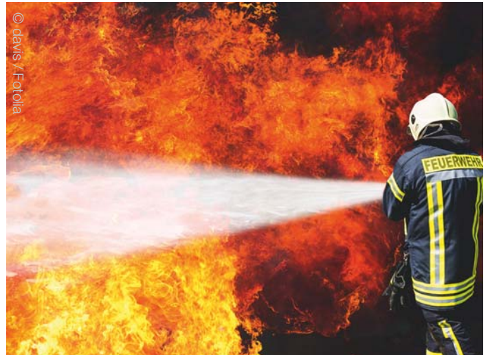
Ein gefürchtetes Szenario vor dem man sich schützen kann

Für Küche und Bäder gibt es spezielle Rauchmelder, die für die Anforderungen