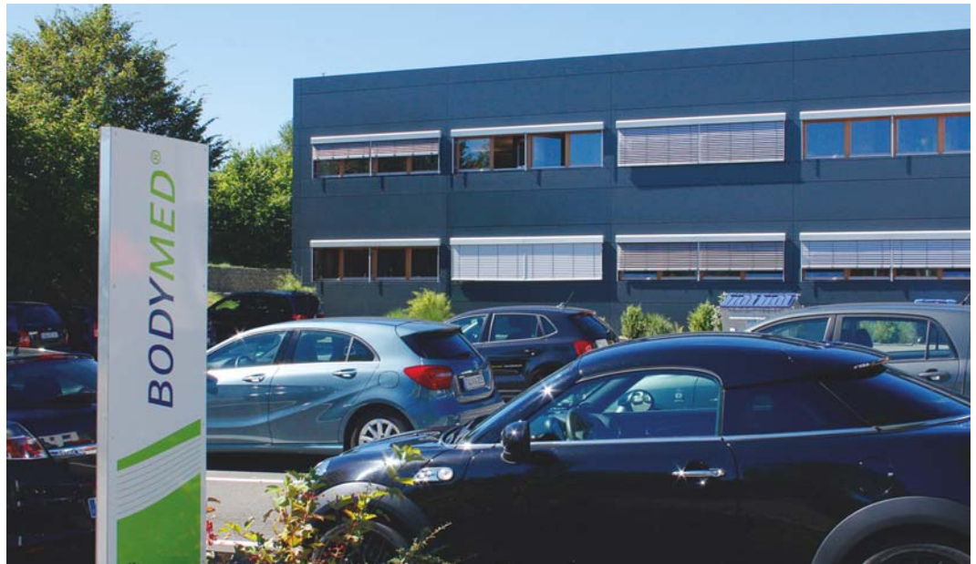
Die neue Bodymed Zentrale in Kirkel

Bodymed ist das führende ärztliche Ernährungskonzept in Deutschland. Die Idee dazu entstand in meiner Praxis. Ich komme aus der klassischen Ernährungsberatung und war auf der Suche nach einem langfristig erfolgreichen Konzept zur Gewichtsreduktion. Bei meinen Recherchen bin ich schließlich auf das Eiweiß unterstützte Fasten gestoßen.