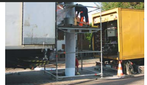
Kanalsanierung mittels Inlinerverfahren, Mandelbachtal-Ormesheim

Weitere Referenzen und Informationen: www.walle.de , Tel: 06893/9477-0