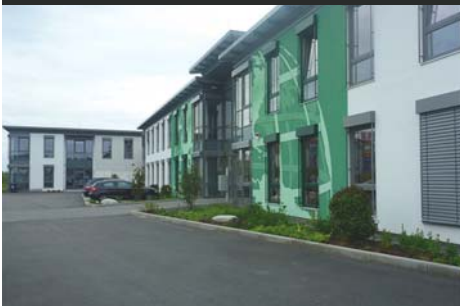
An-/Umbau Büro- und Technik-Gebäude, Key-Systems, St. Ingbert