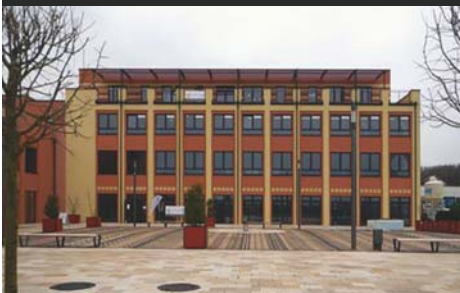
Neubau Medical-Vital-Center, Saarland Thermen Resort Rilchingen