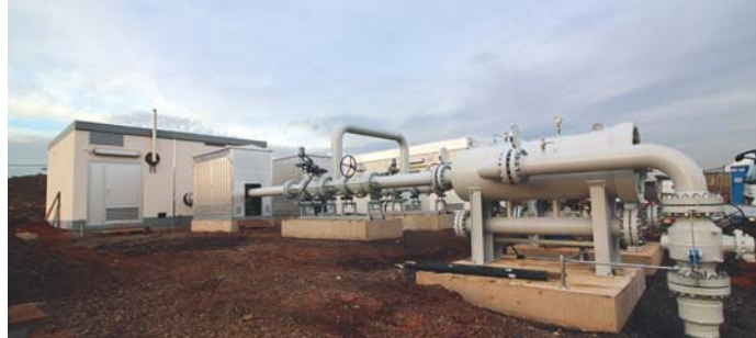
Gasübernahmeanlage in Merzig-Bietzen von der Planung bis zur Realisierung

freien Zustand gehalten und an veränderte Versorgungs- und Betriebsbedingungen angepasst werden.