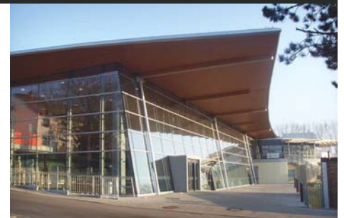
Neubau Hallenbad, St. Ingbert