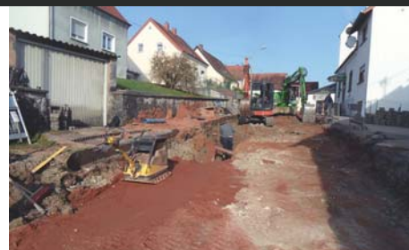
Straßen- und Kanalerneuerung Pfarrer- Schlick-Straße, Gersheim-Rubenheim