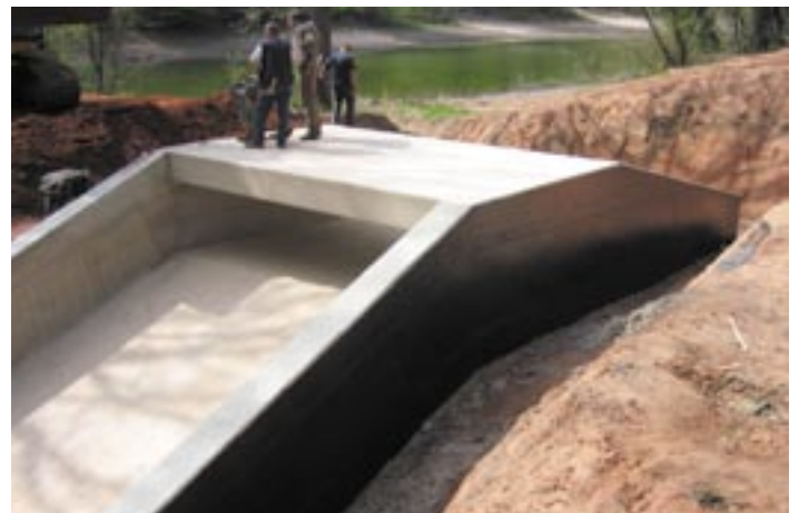
So sah die fertige Dammscharte vor der abschließenden Geländemodellierung aus.