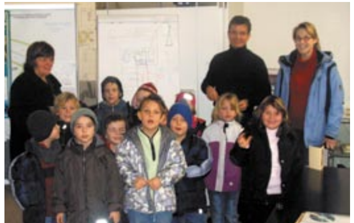
13 kleine Planer waren bei der Walle GmbH zu Gast.

Spaß hat es den Kinder gemacht – und sie wissen jetzt ein gutes Stück mehr über die Planung und Entstehung eines Traumhauses.