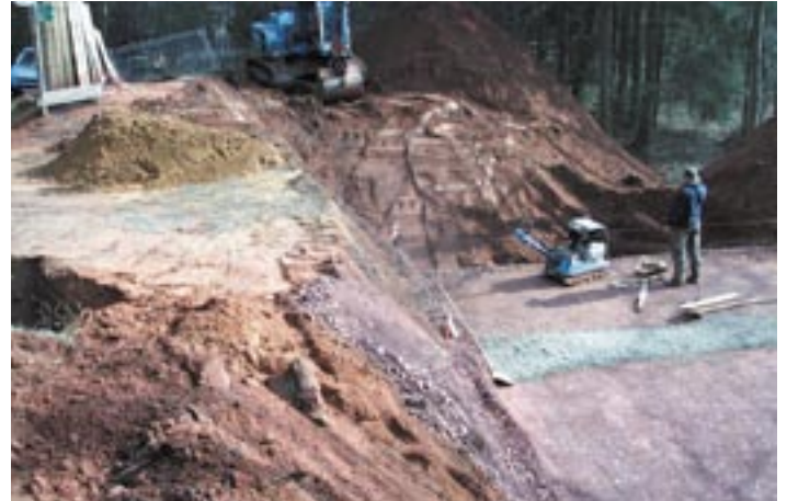
Am Warndtweiher ist mit der Sanierung ein weiterer Schritt für die touristische Nutzung unternommen.

Bauzeit gesamt (inkl. witterungsbedingtem Baustopp): 6 Monate