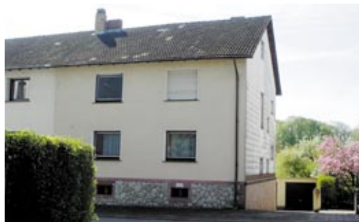
Ein Wertgutachten hilft Käufer und Verkäufer.

Doch auch bei vielen anderen Gelegenheiten bietet das Wertgutachten eines erfahrenen Gutachters die Sicherheit,