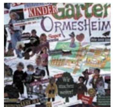
Der Kindergarten in Ormesheim – seit 10 Jahren beliebt.

Das Architektur- und Ingenieurbüro Walle, das damals die Bauplanung und -leitung durchführte, gratuliert ganz herzlich zum Geburtstag und wünscht weiterhin viel Erfolg.